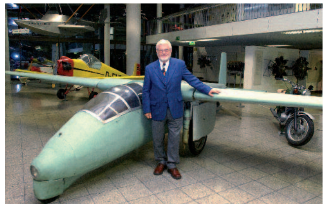
DOWA 81 mit seinem Erbauer im Deutschen Museum München

Der Vorsitzende Richter und Direktor des zuständigen Kreisgerichts verurteilte die Familie zu insgesamt zwölf Jahren Freiheitsstrafe; selbst die minderjährigen Söhne wurden nicht verschont und mit eineinhalb bzw. einem Jahr Gefängnis abgeurteilt. Ein Jahr später konnte die Familie Wagner durch Initiative der Bundesregierung freigekauft und in die Bundesrepublik „ausgebürgert“ werden. Nach