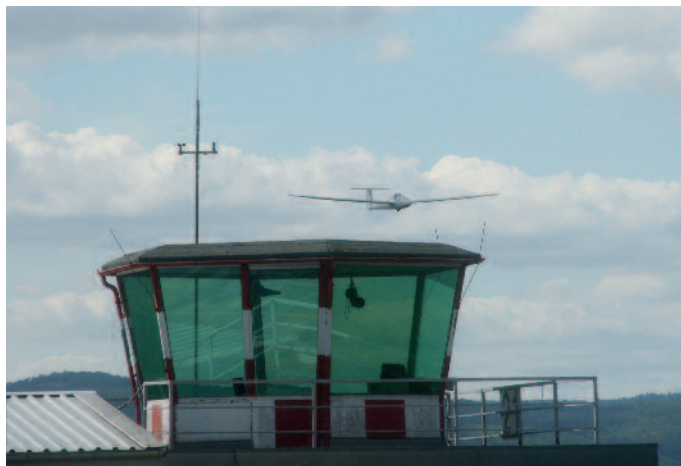
Clear to land: Endanflug der GFW-3 auf die Landebahn NULL-VIER in Bad Sobernheim

Erneut im Bereich des Dombergs angekommen, baute ich meine Höhe ab und bereitete die bevorstehende Landung vor. Rechter Gegenanflug auf die NULL-VIER, Queranflug, Endteil mit Klappenstellung +34°. Problemlos glitt ich über die Hangkante vor der Bahn und setzte kurz hinter der Schwelle sauber und weich auf der Graspiste auf.